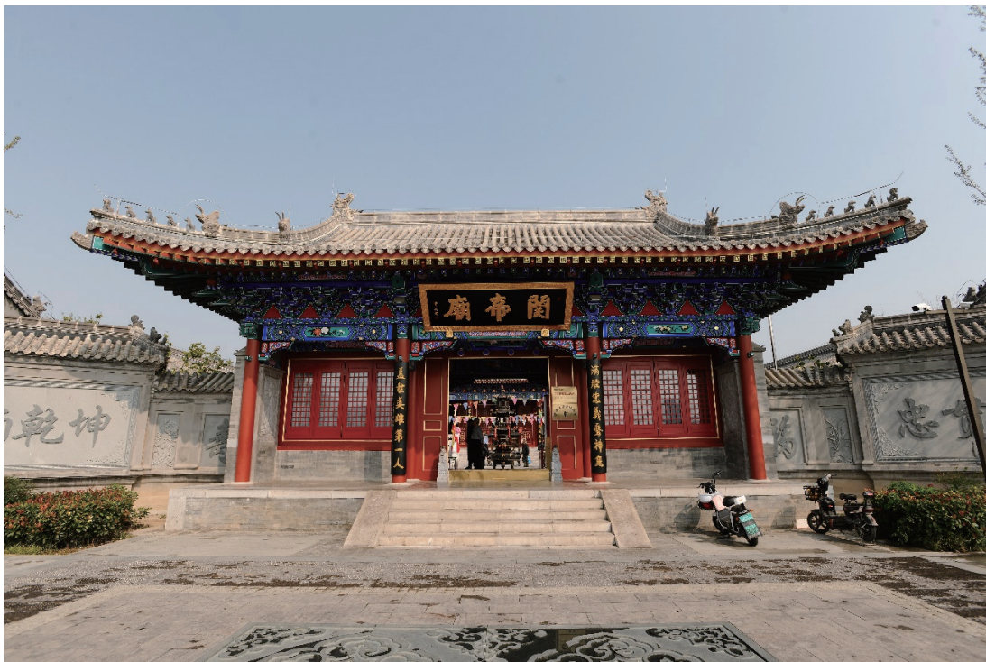
曹州古城中的关帝庙

近日在菏泽多个群体中，对曹州老城中的旧时庙祠进行了一次探讨，其间又有人提出了“七十二说”，这便产生了分歧，多家多个观点，至今争论不休。于是我查阅了多部方志，发现资料中记载的很少。我又去老城中去查访，发现有些庙祠群落的中的庙堂难以分割，也难以统计。由此分析其多家的观点，并不十分矛盾，都有一定的道理。有的凡指具备一定规模的庙祠，是不足七十二数的。有的把大大小小的都统计在一起，又会超出七十二数。