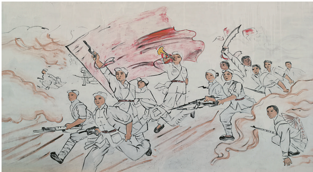
村头墙壁上绘制的“抗战宣传画”

罪行，宣传根据地军民抗战胜利消息。一月后，中共苏鲁豫特委撤销，建立苏鲁豫区党委，《团结日报》印刷设备从张花园村秘密转移到张寨村，从此发行湖西全区。