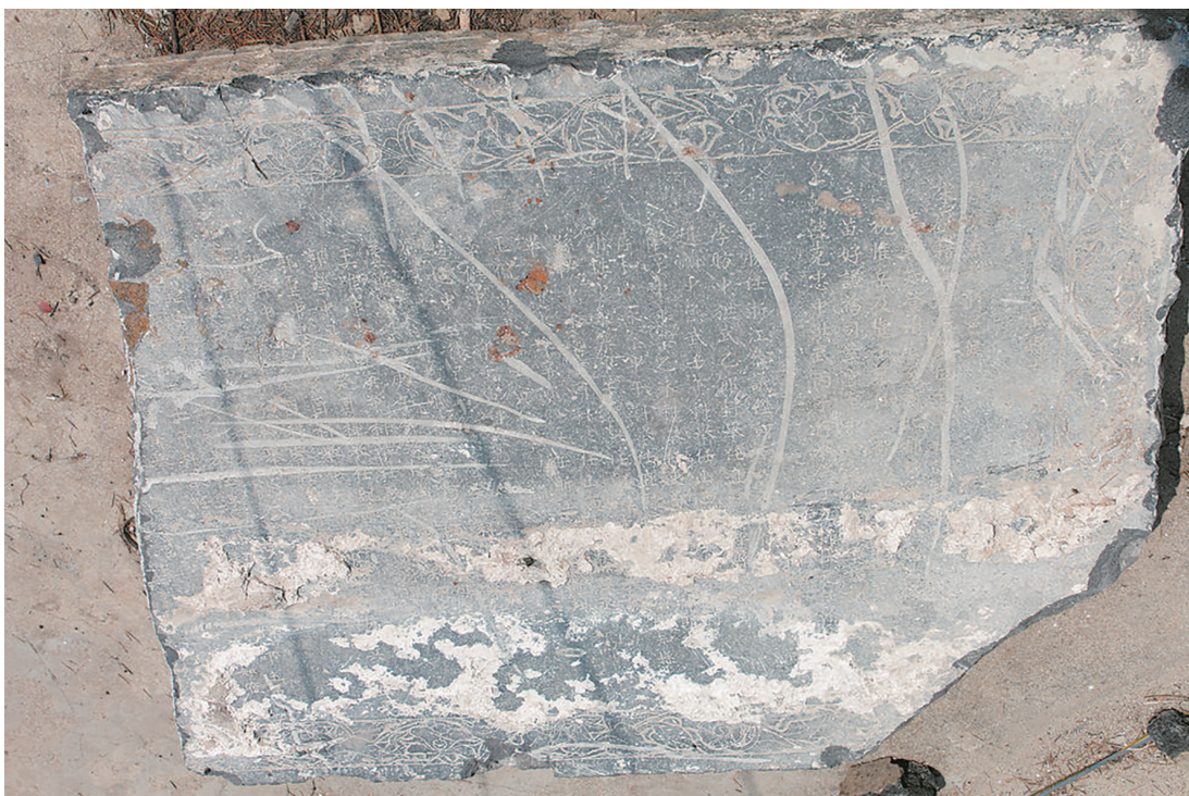
明代成武县文庙中“兖州府成武县古今人物志”石碑上刻着韩克忠的名字

在封建社会的科举制度下，能够中得状元，不但对本人来说是一件极为骄傲的事情，而且，对状元的家乡来说，也是一件非常骄傲的事情，因为，这代表了一个地方的学风。人们常常说一个地方出现了许多名人，就说这个地方“地灵人杰”，所以，也产生了诸多的名人之争。而明代的第一位山东状元韩克忠的家乡，因为历史的原因，也产生了故里之争。