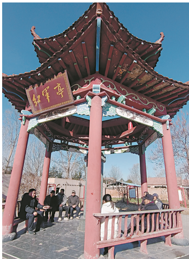
张寨村老人们在红军亭讲红色故事

地区及其张寨村党组织、人民子弟兵经受住了严峻的考验，表现出了坚忍顽强的革命精神，为抗日战争、解放战争及新中国成立作出了不可磨灭的贡献。