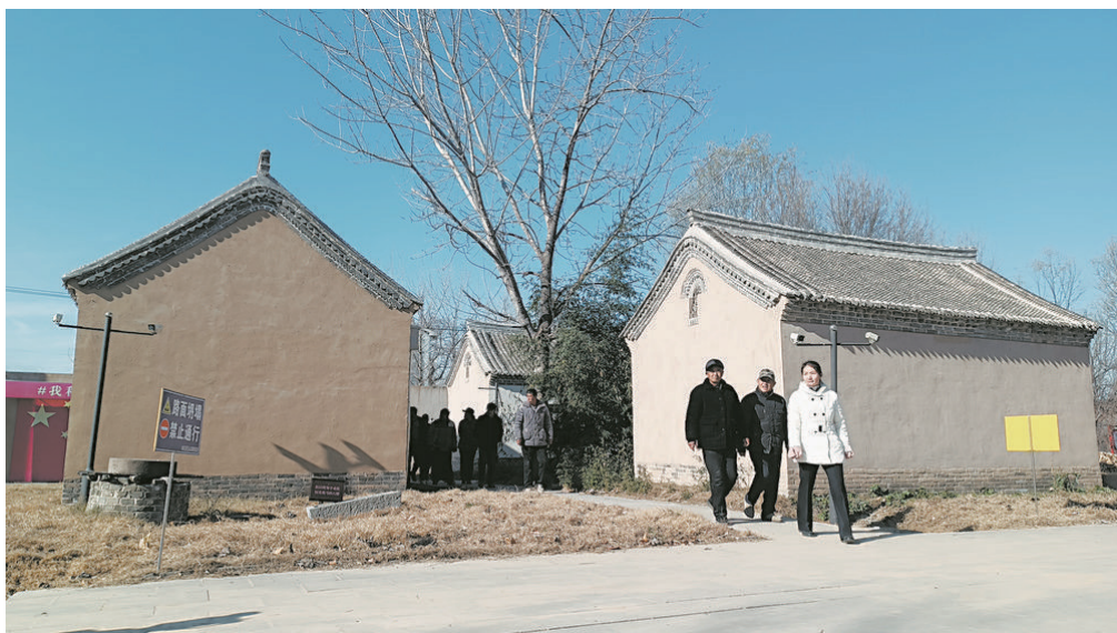
当年湖西党组织、抗日军民驻地遗址

湖西位于鲁苏豫皖四省结合部，因在山东微山湖、昭阳湖、独山湖、南阳湖以西，故称湖西。抗战时期，湖西区是与冀鲁豫区、豫皖苏区齐名的抗日根据地。单县是湖西区的中心，是湖西区党委、专署、军分区所在地。