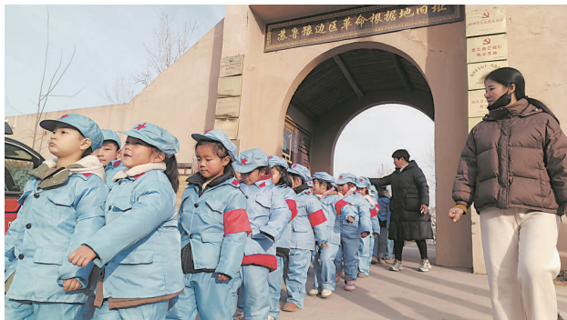
“小红军”到张寨村参观红色遗址

在鲁苏皖三省交界区，有一个现隶属于单县朱集镇的小村，名叫张寨。在中国共产党发展史和红色湖西区革命史中，张寨村功绩显赫。