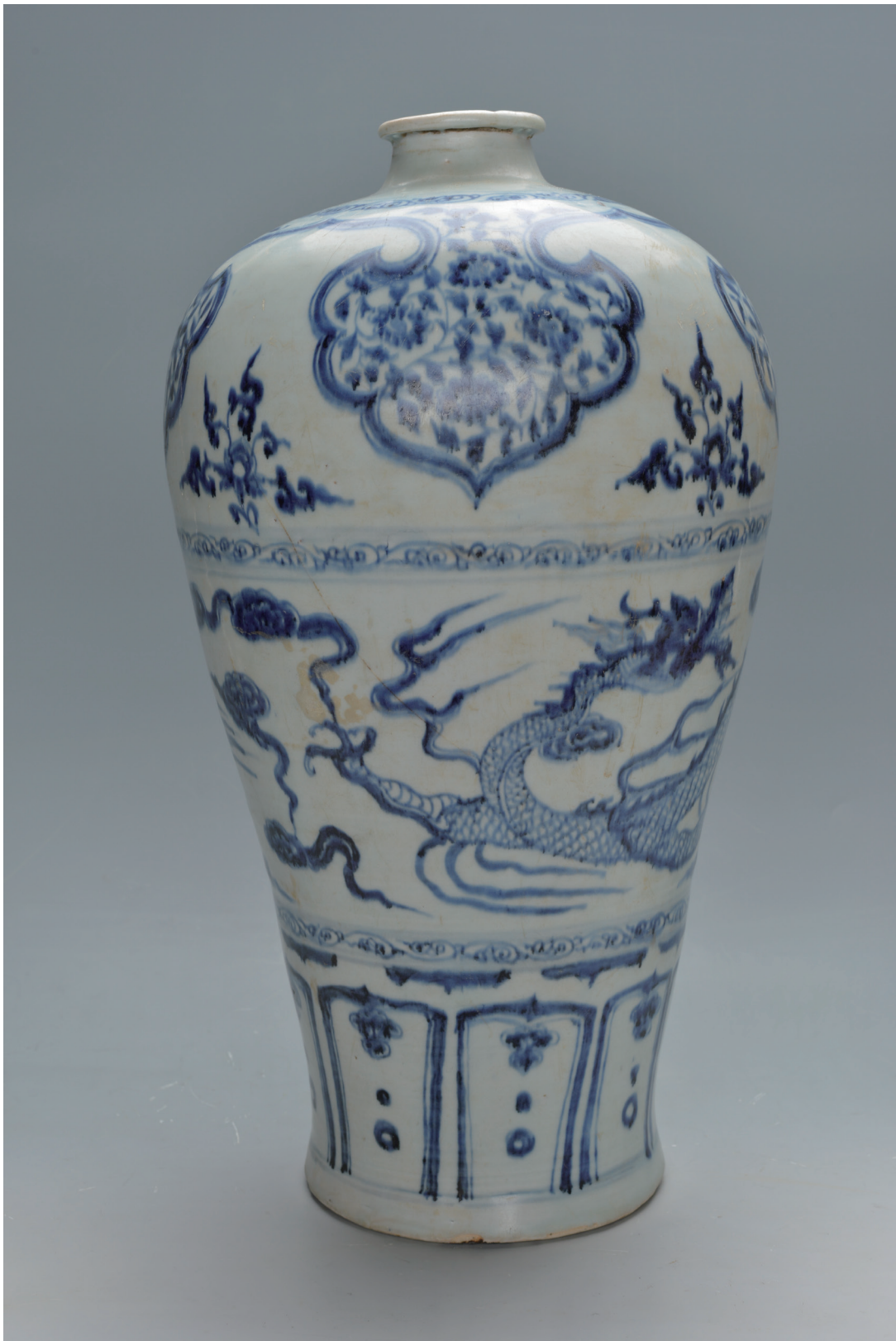
菏泽市博物馆馆藏文物展示：青花龙纹梅瓶 年代：元 尺寸：高 42.5 厘米 口径 6.3 厘米 底径 14.6 厘米