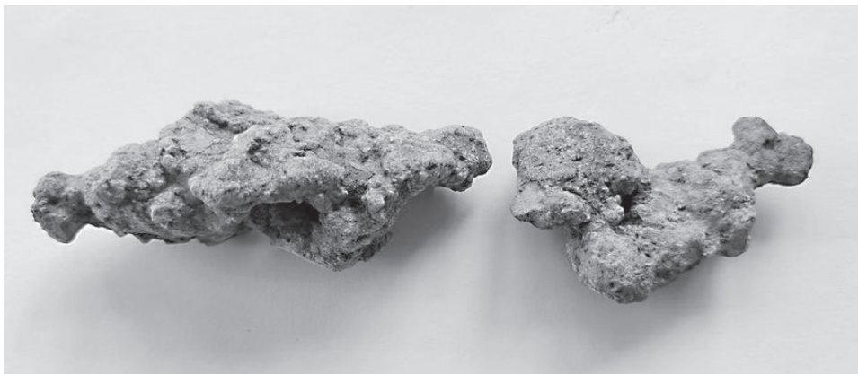
项梁墓出土的“化石猴”

历史不能假设。那些战马嘶鸣、刀光剑影的历史故事已经随风远去，后人来项梁墓前，也只能感慨“千年遗恨大江流”了。如今，项梁墓已成省级文物保护单位，时常有文人墨客前来凭吊怀思。